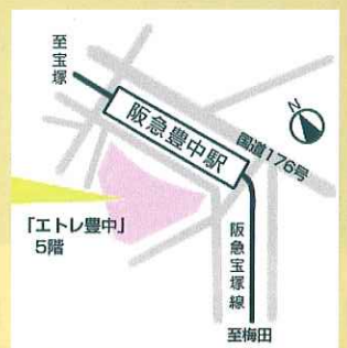
阪急宝塚線 豊中駅下車すぐ エトレ豊中5階